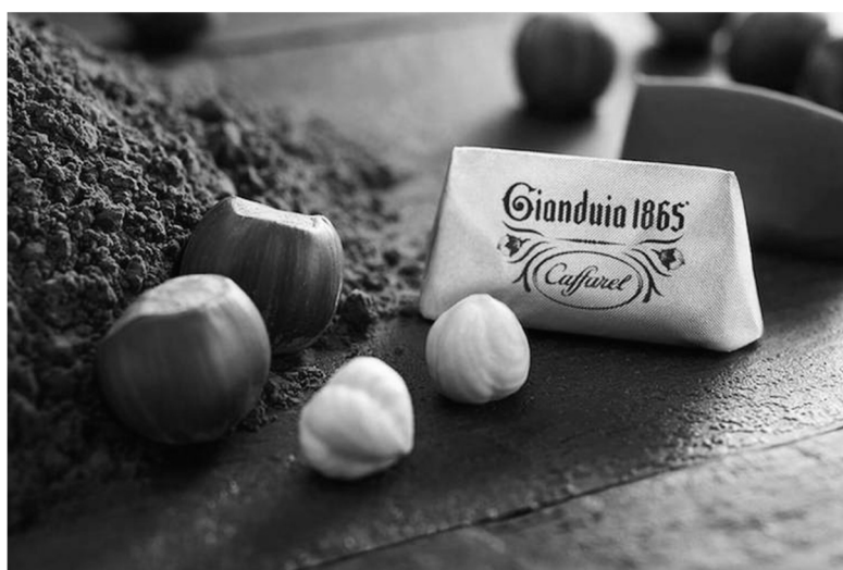
Il cioccolato gianduia